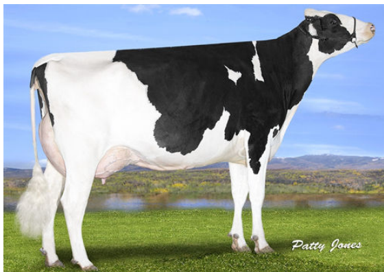
OCD DELTA MISSY DAM