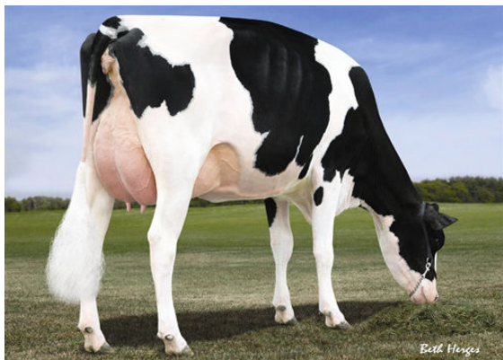
MORSAN MAN D MISSY THIRD DAM