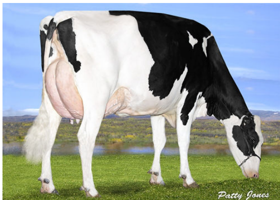
OCD DELTA MISSY DAM